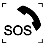
Рисунок 5 — Изображение пиктограммы «Экстренный вызов»

22.1 Кнопка «Экстренный вызов» и оптический индикатор состояния автомобильной системы/устройства вызова экстренных оперативных служб должны содержать изображение пиктограммы «Экстренный вызов». Изображение пиктограммы «Экстренный вызов», выполненное в соответствии с [13], представлено на рисунке 5. Оптический индикатор состояния АС может конструктивно совмещаться с кнопкой «Экстренный вызов».