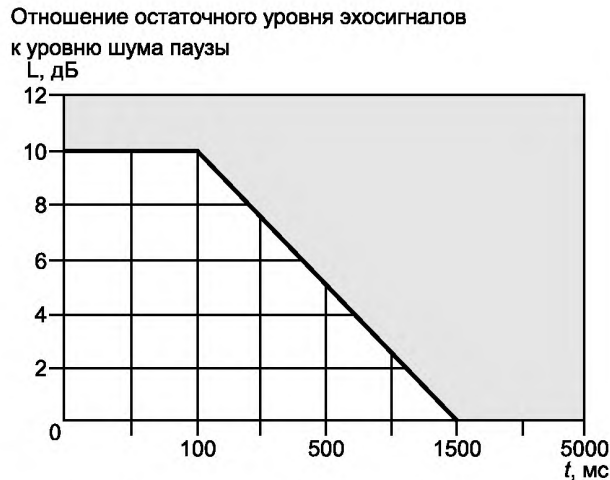
Рисунок И.2 — Зависимость отношения остаточного уровня эхосигналов к уровню шума паузы от времени [3]

Примечание — Измерение проводится для АС, установленной в салоне (кабине) ТС, от электрического входа до электрического выхода речевого кодека на стороне оператора при наличии шумов различного уровня в кабине ТС.