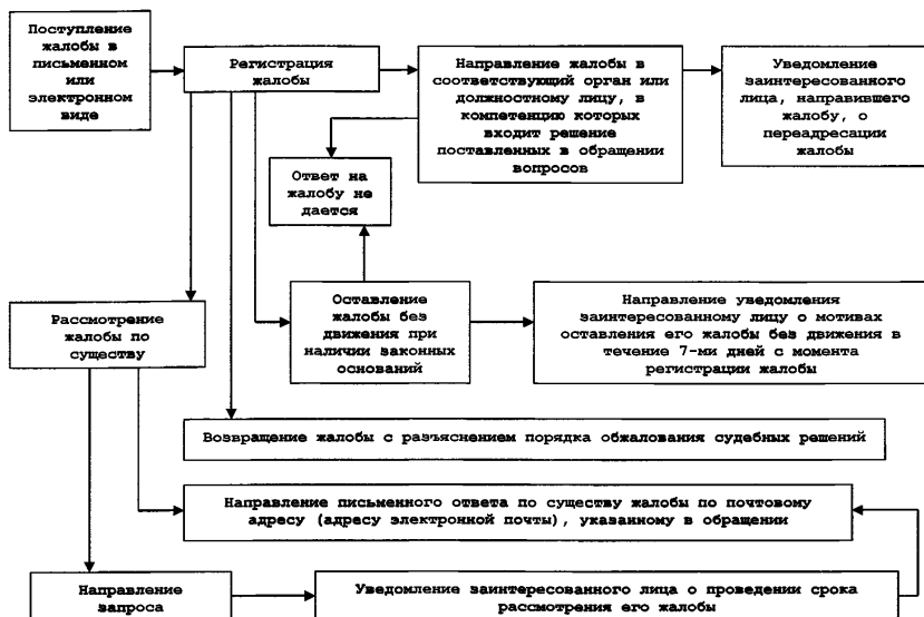
Рисунок 2 – Рассмотрение жалоб на решения или действия (бездействие) надзорных органов в области ЧС и их должностных лиц

13.2. Персональная ответственность за исполнение государственной функции закрепляется в функциональных обязанностях должностных лиц надзорных органов