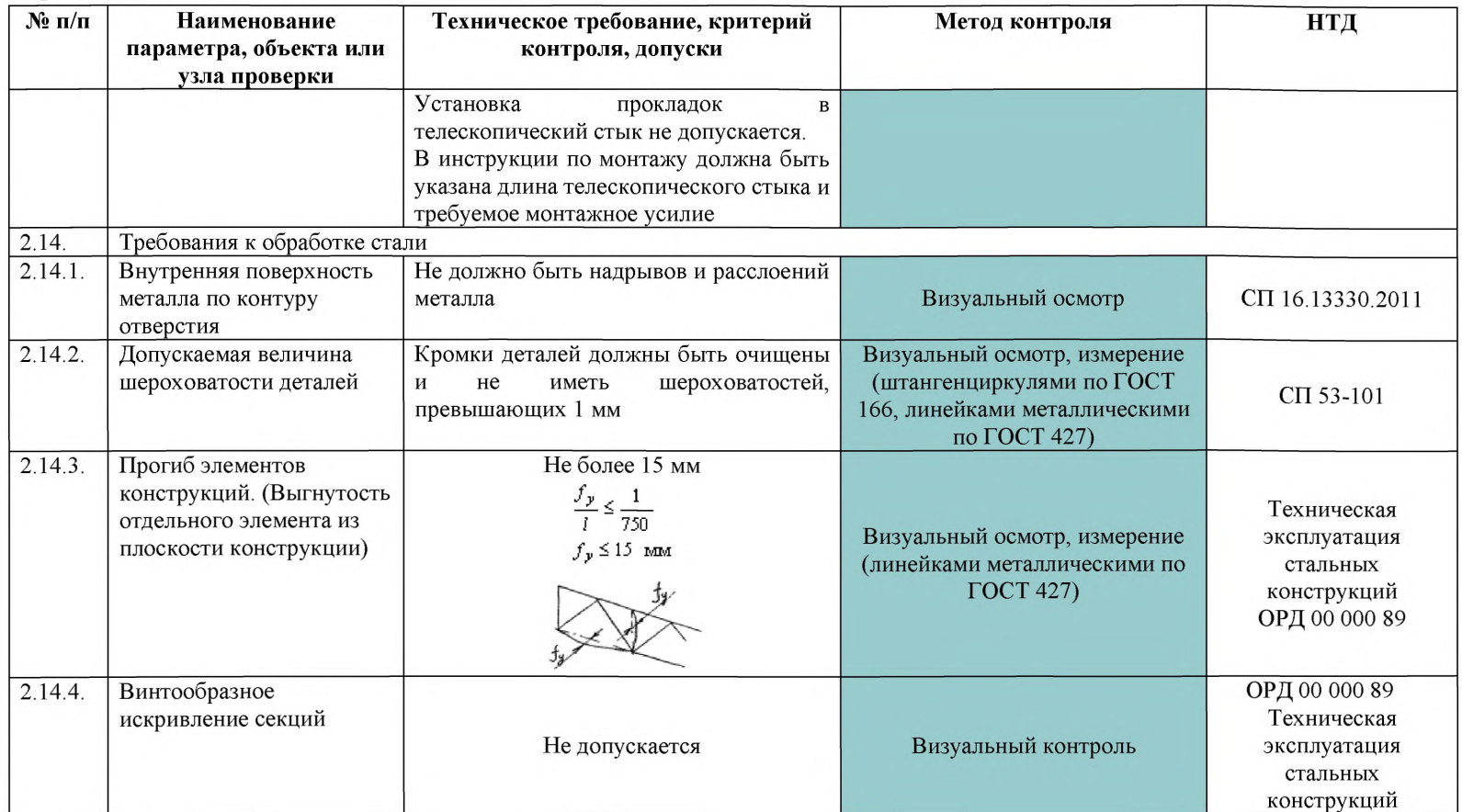
Продолжение Таблицы 5.3.