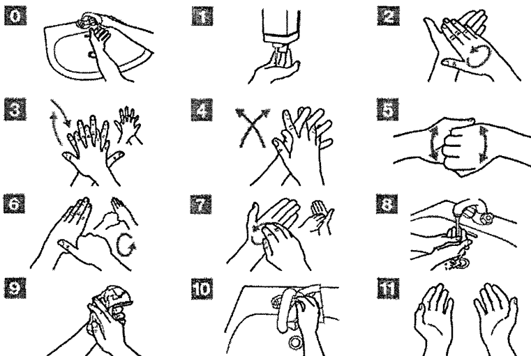
Рис. 11. Процедура закончена.

Рис. 10. Использовать полотенце для закрытия крана.