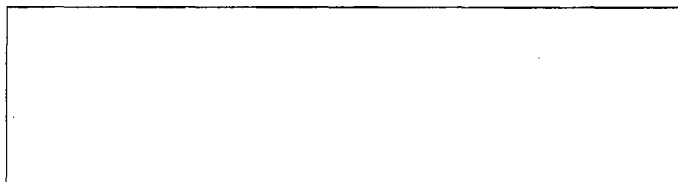
Схема границы балансовой принадлежности тепловых сетей

Прочие сведения по установлению границ раздела балансовой принадлежности тепловых сетей _____