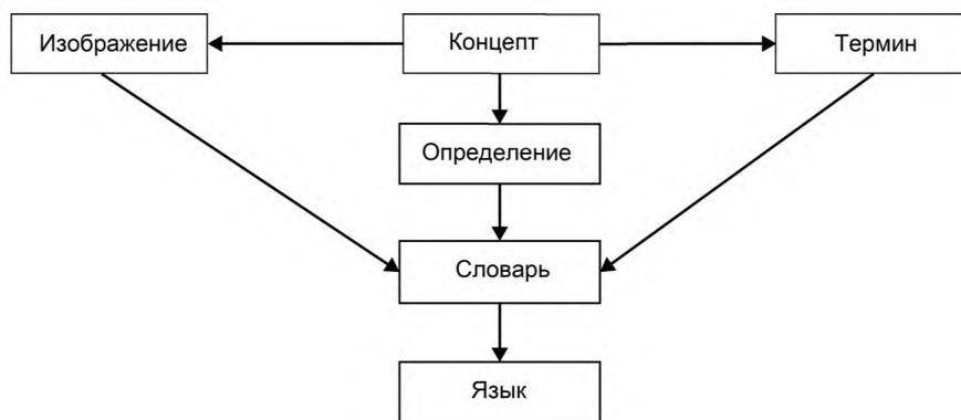
Рисунок 1 — Концептуальная модель терминологии высокого уровня

Каждый концепт имеет одно или несколько определений. Каждое определение относится только к одному концепту.