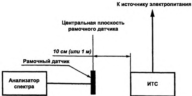
Рисунок А.2 – Испытательная установка для измерения магнитного поля, создаваемого ТС