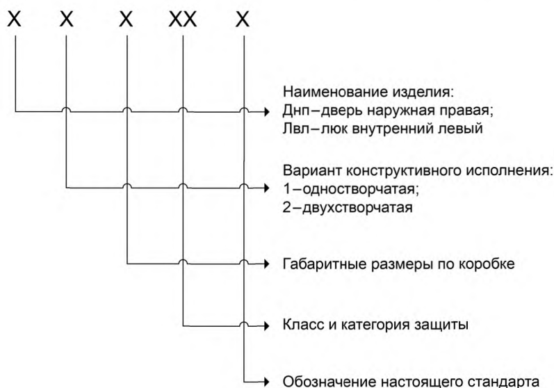
Примеры условного обозначения

4.3.2 Устанавливают следующую структуру условных обозначений ВЗК в документации при оформлении заказа.