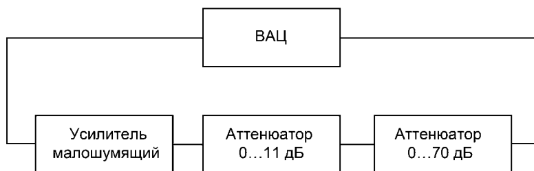
Рисунок В.2 — Схема калибровки тракта