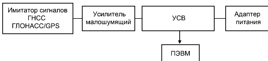
Рисунок В.1 — Схема испытательного стенда