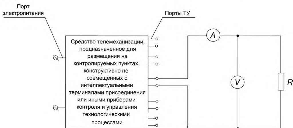
Рисунок 2 — Схема проверки параметров сигнала ТУ

Значение сопротивления R с учетом соединительных проводов должно составлять (150,0 \pm 22,5) Ом.