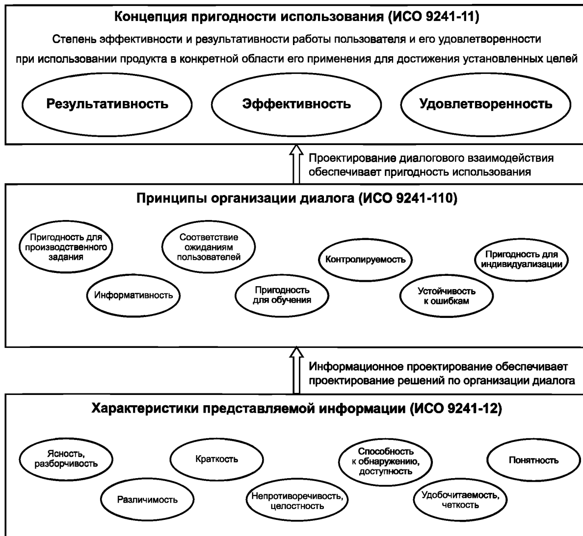
Рисунок 2 — Взаимодействие между настоящим стандартом, ИСО 9241-11 и ИСО 9241-12