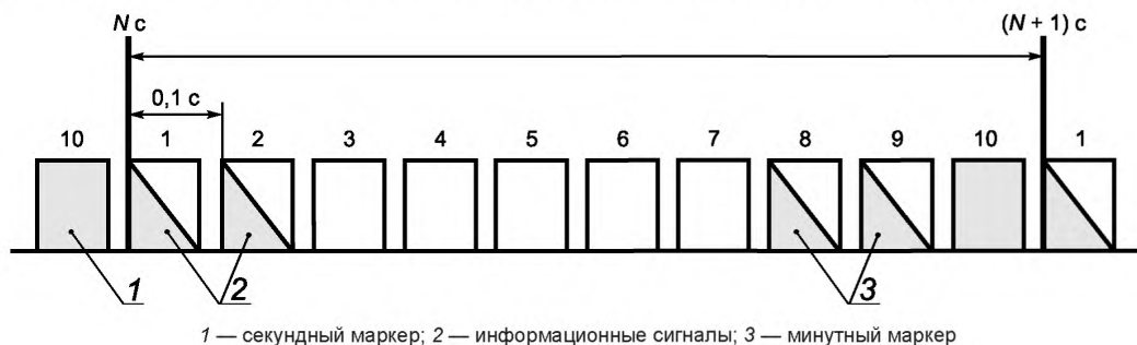
Рисунок 1 — Информационная структура сигнала

4.2 Элементы кода передают раз в секунду путем модуляции несущих колебаний в первом и втором 0,1-секундных интервалах, отсчитываемых от секундного маркера (см. рисунок 1).