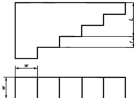
w — ширина ступеньки; r — высота ступеньки; L — длина образца С (таблица 1)