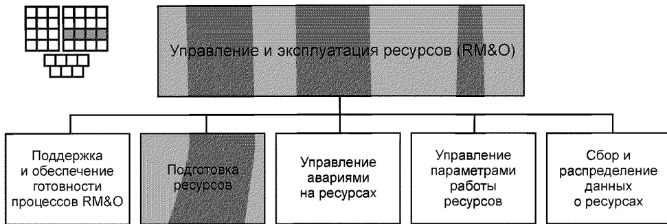
Рисунок 1 — Декомпозиция группы процессов RM&O на элементы процессов уровня 2