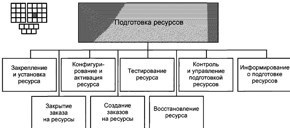
Рисунок 3 — Декомпозиция процесса 1.1.3.2 — «Подготовка ресурсов» на элементы процессов уровня 3

6.2 Процесс 1.1.3.2 и его элементы процессов уровня 3 предназначены для создания и выполнения заказов на ресурсы посредством подготовки ресурсов к оказанию услуг. Заказы на ресурсы создаются в ответ на запросы от процессов: обработки заказов на услуги, восстановления ресурсов после отказов, контроля производительности ресурсов, поставки ресурсов поставщиками/партнерами.