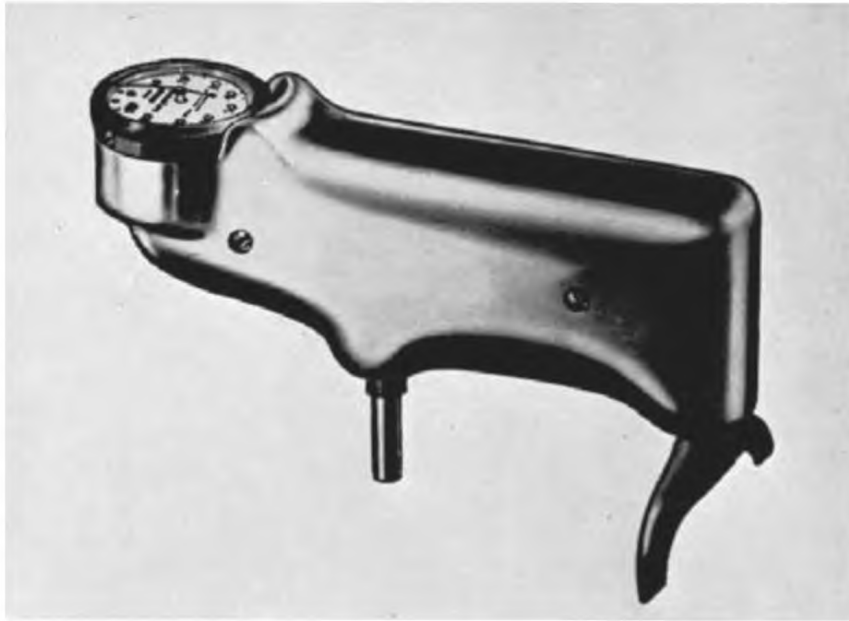
Рисунок 1 — Твердомер Баркола