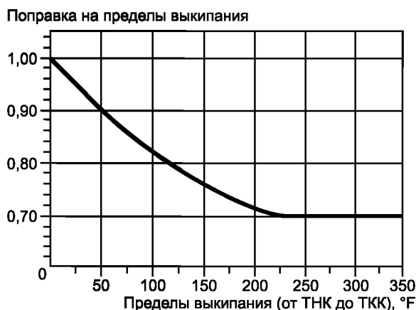
Рисунок А2.1 — Поправка на пределы выкипания

Примечание А2.2 — Поправку на пределы выкипания используют для крекингových нафтен, поскольку эмпирически установлено, что содержание олефинов (% об.) выше во фракциях с более низкими температурами кипения, и эти олефины также имеют более низкую молекулярную массу (молекулярный вес).