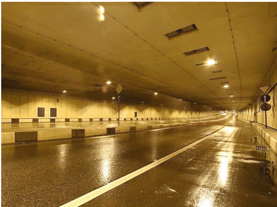
Рисунок Д.1 – Рассматриваемый автодорожный тоннель

Рассматриваемое сооружение – автодорожный тоннель, в транспортной зоне которого монтируется облицовка (представлен на рисунке Д.1).