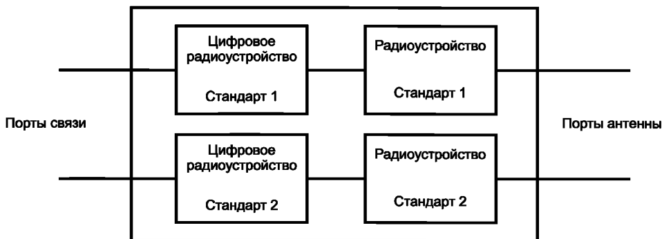
Рисунок 1 — Многокантовое радиооборудование с индивидуальными радиоинтерфейсами

многокантовое радиооборудование с общим радиоинтерфейсом (multi-standart radio): Радиооборудование, приемник и передатчик которого способны одновременно проводить обработку двух или большего числа несущих частот с использованием общих активных радиочастотных компонентов в полосе радиочастот, заявленной изготовителем, причем по меньшей мере на одной несущей частоте применяется технология радиодоступа, отличная от применяемой на другой несущей частоте (частотах).