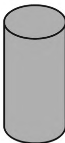
Рисунок 2 — Агломерированная корковая пробка

5.2 Агломерированные корковые пробки — это пробки, корпус которых целиком состоит из агломерата (рисунок 2). Пробки этого типа не следует использовать для игристых вин.