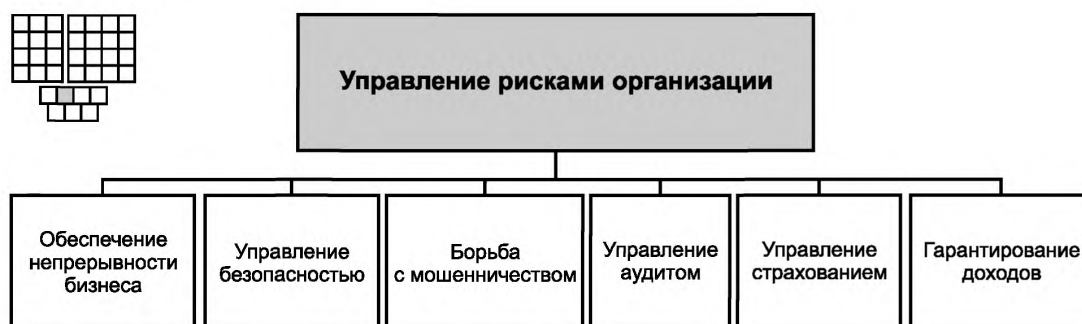
Рисунок 3 — Декомпозиция группы процессов «Управление рисками организации» на элементы процессов уровня 2

6.2 Процессы группы 1.3.2 предназначены для выявления рисков и угроз потери доходов или репутации организации, кроме того они должны обеспечивать минимизацию или устранение влияния выявленных рисков. Обнаружение рисков должно осуществляться как для физических, так и для логических/виртуальных рисков.