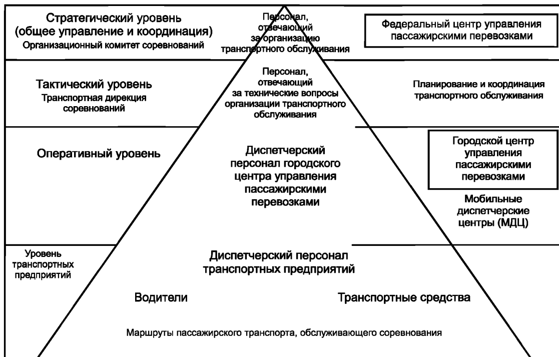
Рисунок 1 — Иерархические уровни ситуационного управления процессами транспортного обслуживания зрителей массовых спортивных мероприятий

4.3 Тактический уровень управления реализуется специально создаваемой организацией — транспортной дирекцией соревнований, на которую возлагаются технические вопросы планирования, организации и координации транспортного обслуживания, включая: