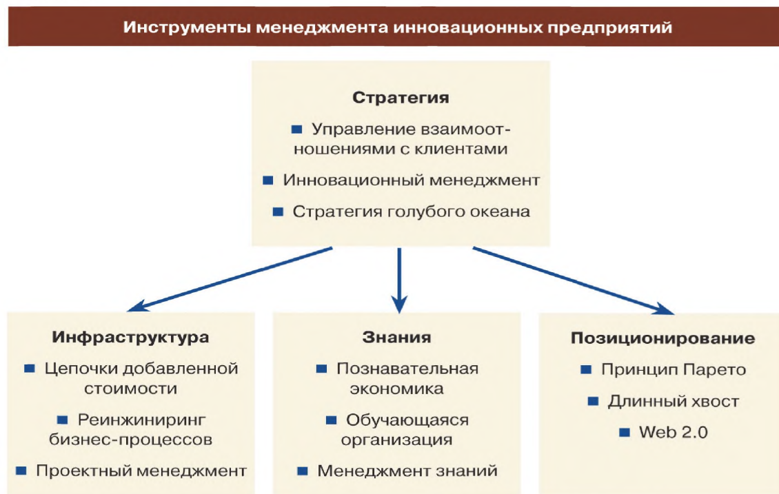
Рисунок 2 — Инструменты менеджмента инновационных предприятий

Эти аспекты приведены на рисунке 2, где в виде схемы представлены механизмы и инструменты менеджмента для разработки стратегии предприятия, а также их применения при создании инфраструктуры предприятия, приобретении и использовании знаний, а также в позиционировании предприятия на современном рынке инновационной продукции. Эти предпочтительные механизмы и инструменты менеджмента целесообразно, в первую очередь, использовать для разработки систем менеджмента инновационных предприятий и стандартов для этих систем.