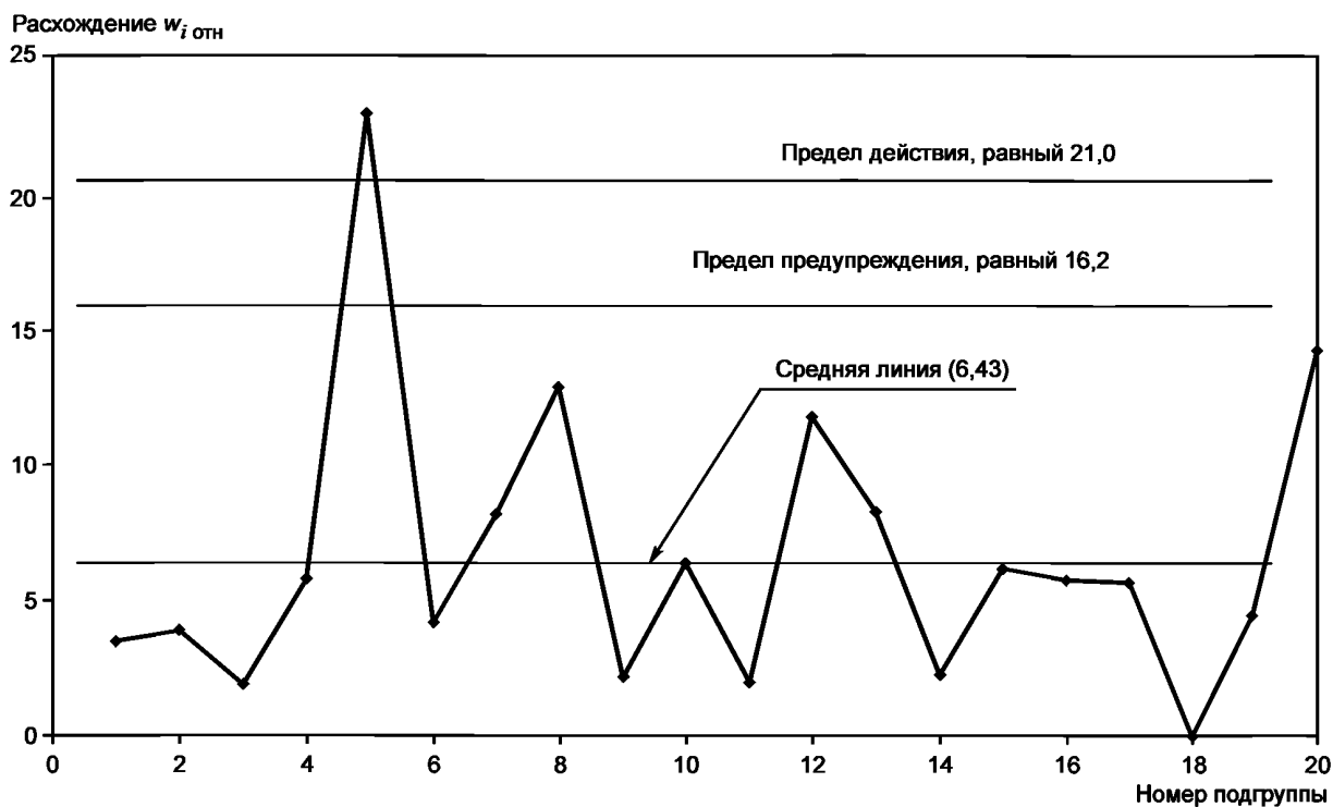
Рисунок В.1 — Карта пределов определения объемной доли метилового спирта, %, в водке, полученных в условиях промежуточной прецизионности с изменяющимися факторами «время» и «оператор»

Оценку стандартного отклонения промежуточной прецизионности с изменяющимися факторами «время» и «оператор» S_{I(ТО)} рассчитывают по формуле