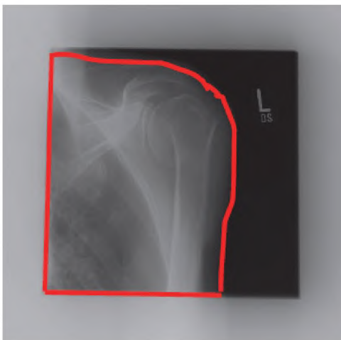
Рисунок А.1 – Типичный пример ИСХОДНЫХ ДАННЫХ рентгенограммы с подчеркнутой ОПОРНОЙ ОБЛАСТЬЮ ИЗОБРАЖЕНИЯ

ПОКАЗАТЕЛЬ ЭКСПОЗИЦИИ в значительной степени зависит от ОПОРНОЙ ОБЛАСТИ ИЗОБРАЖЕНИЯ. Поскольку настоящий стандарт не определяет выбора ОПОРНОЙ ОБЛАСТИ ИЗОБРАЖЕНИЯ, вполне возможны отклонения для различных РЕНТГЕНОВСКИХ ЦИФРОВЫХ СИСТЕМ. При выборе ОПОРНОЙ ОБЛАСТИ ИЗОБРАЖЕНИЯ необходимо учитывать, что типичные изображения в рентгенологии охватывают широкий диапазон значений ВОЗДУШНОЙ КЕРМЫ НА ПРИЕМНИКЕ ИЗОБРАЖЕНИЯ. Типичный вид ИСХОДНЫХ ДАННЫХ рентгенограммы представлен на рисунке А.1.