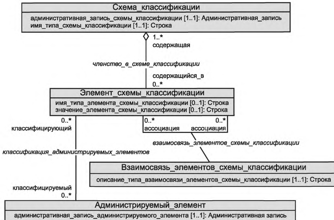
Рисунок А.1 — Область классификации метамодели