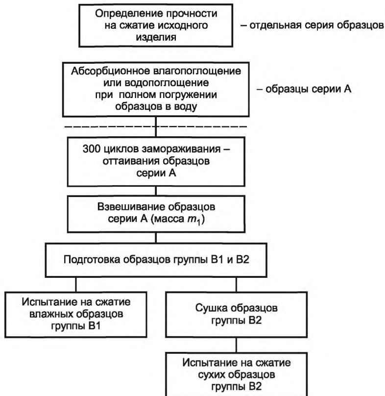
Рисунок 1 — Схема проведения испытания

Определяют характеристики сжатия образцов: предел прочности при сжатии \sigma_m или прочность на сжатие при 10 %-ной деформации \sigma_{10} в соответствии с требованиями EN 826. Для определения характеристик сжатия до испытания на морозостойкость должна быть изготовлена отдельная серия образцов (см. рисунок 1).