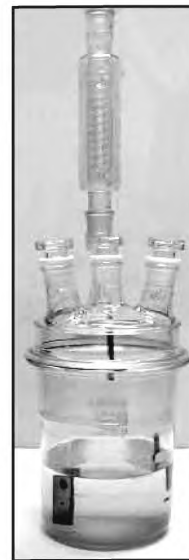
Рисунок 3 — Реакционный сосуд с парциальным конденсатором

4.2.3.7 После окончания испытания металлические образцы промывают и очищают щеткой с синтетической или натуральной щетиной (неметаллической). Остатки, которые невозможно удалить механическим путем (появившиеся продукты коррозии или отложения), удаляют с помощью ингибированных растворов для травления.