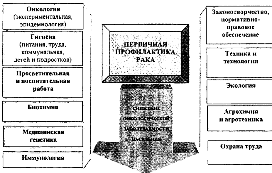
Рис. 1.2. Стратегической целью ППР является снижение онкологической заболеваемости населения

ственных опухолей, по крайней мере, на одну треть». Опыт экономически развитых стран подтверждает такую возможность.