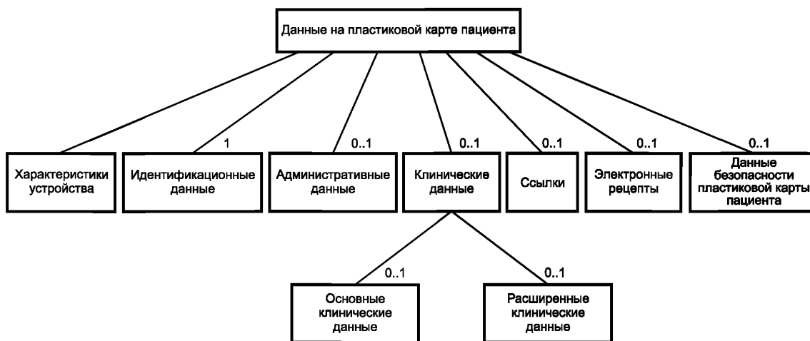
Рисунок 1 — Общая структура данных на пластиковой карте пациента

Представленные на рисунке 1 классы информационных объектов определены в других частях стандарта ИСО 21549.