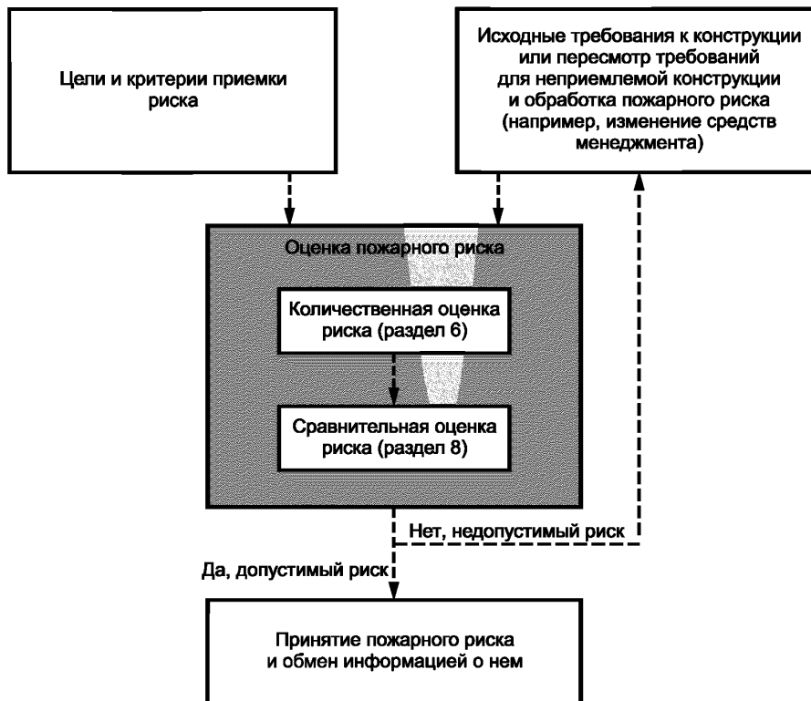
Рисунок 1 — Схема менеджмента пожарного риска

конструкцию объекта защиты и направлена на достижение выполнения критериев допустимости и соответствия установленным требованиям.