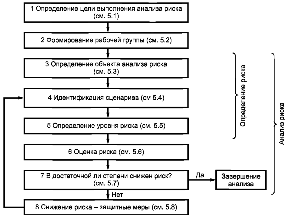
Рисунок 1 — Схема выполнения анализа и снижения риска