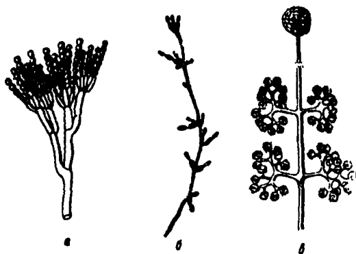
Рис. 2. Плесени: