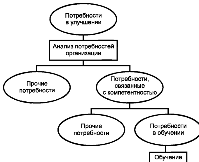
Рисунок 1 — Повышение качества посредством обучения

Настоящий стандарт устанавливает требования при идентификации и анализе потребностей в обучении, планировании и составлении программы обучения, проведении обучения, оценке результатов обучения, а также при мониторинге и улучшении процесса обучения для достижения поставленных целей. В стандарте подчеркнута особая важность обучения при решении задач по постоянному улучшению. Обучение должно стать результативным и эффективным способом вложения инвестиций организации.