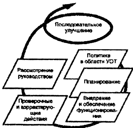
Рисунок - Модель системы управления охраной труда (СУОТ)

Методология создания и функционирования систем управления (менеджмента) по ряду направлений определяется общепризнанными международными стандартами ИСО серии 9000 (управление качеством) и ИСО серии 14000 (управление охраной окружающей среды). В основе методологии создания и функционирования систем управления, определяемой этими международными стандартами, положены известные принципы: "планируй - выполняй - контролируй - совершенствуй", реализуемые в рамках политики в рассматриваемом направлении деятельности. Модель такого подхода приведена на рисунке.