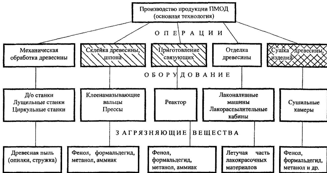
Рис.2.1. Классификация источников загрязнения газопылевых выбросов предприятий механической обработки древесины