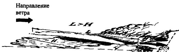
Рис. 3. Схема применения устройства для тушения проливов ЛВЖ способом “срезания” пламени

Нужно также учитывать высокую скорость подачи ОТВ. Управление стволом должно быть плавным, чтобы не разбрызгивать горючую жидкость и не допустить проскока пламени. При тушении ЛВЖ с близких расстояний в первый момент подачи ОТВ нужно быть готовым к импульсивному выбросу тепла из очага горения.