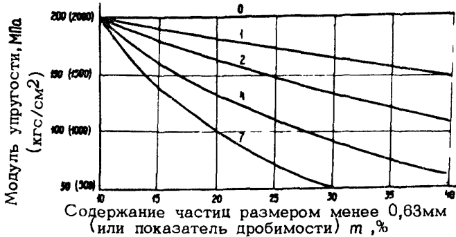
Рис.3.1. Зависимость модуля упругости основания от содержания частиц размером менее 0,63мм (цифры на кривых - число пластичности мелких частиц)

х) Над чертой - модуль упругости осадочных пород, под чертой - магматических.