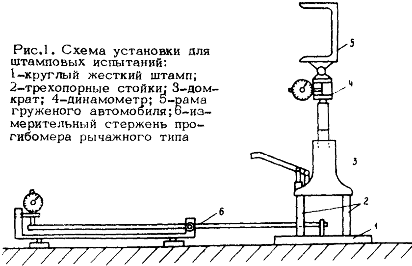
Рис.1. Схема установки для штамповых испытаний: 1-круглый жесткий штамп; 2-трехопорные стойки; 3-домкрат; 4-динамометр; 5-рама грузе-ного автомобиля; 6-из-мерительный стержень про-гибомера рычажного типа

Нагрузка на поверхность испытуемой конструкции пе- редается через круглый жесткий штамп (1) и домкрат (3), упираемый в раму грузе-ного автомобиля (5). Велич и н а нагрузки на штамп измеряется с помощью механического динамометра (4). Домкрат устанавливается соосно на трехопорных стойках (2).