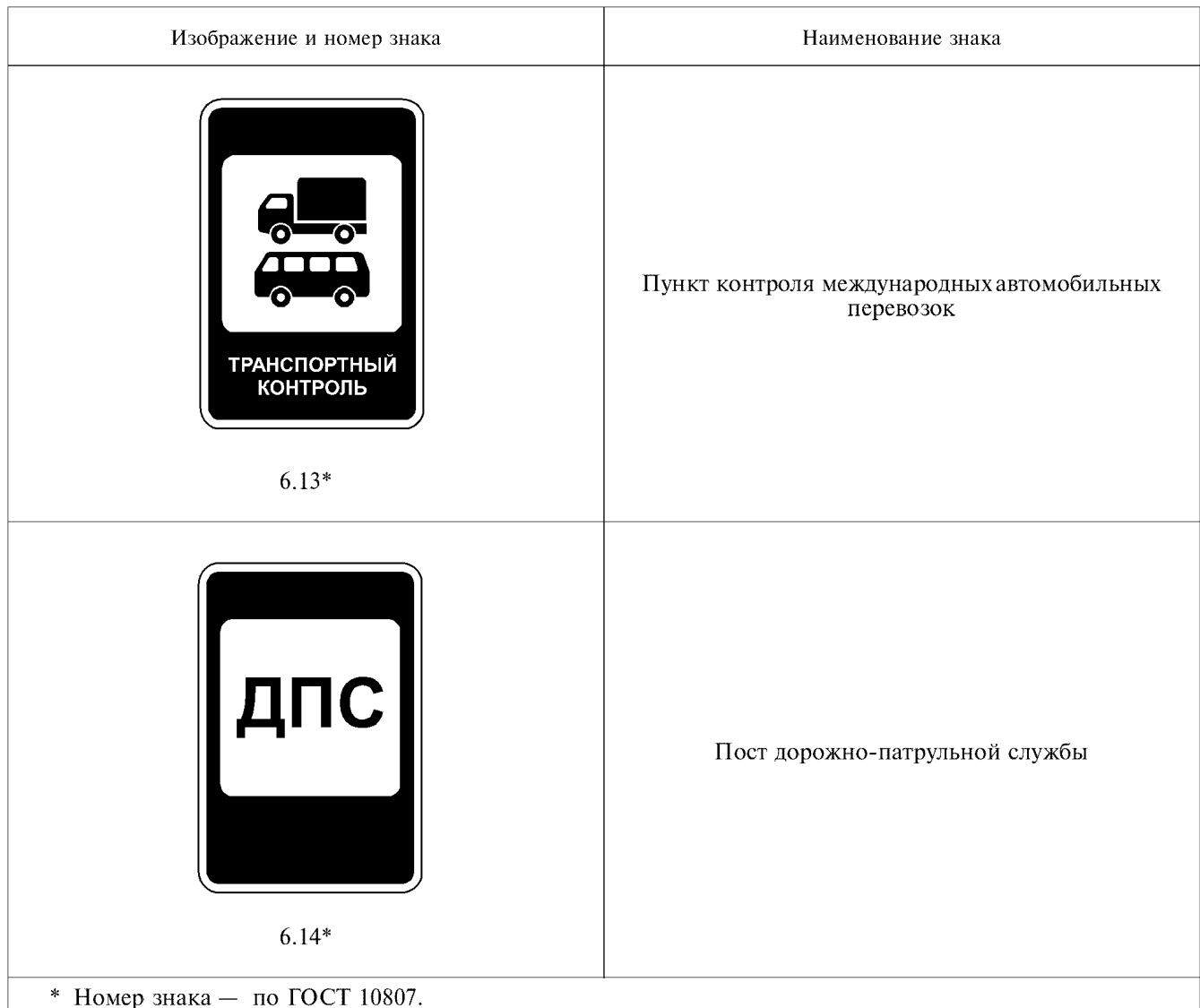
Т а б л и ц а А.1