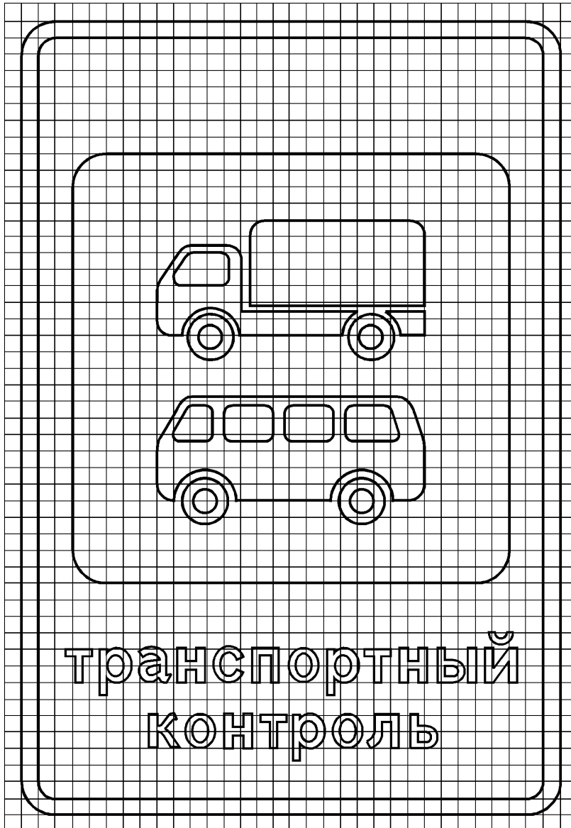
Рисунок Б.1 — Знак 6.13