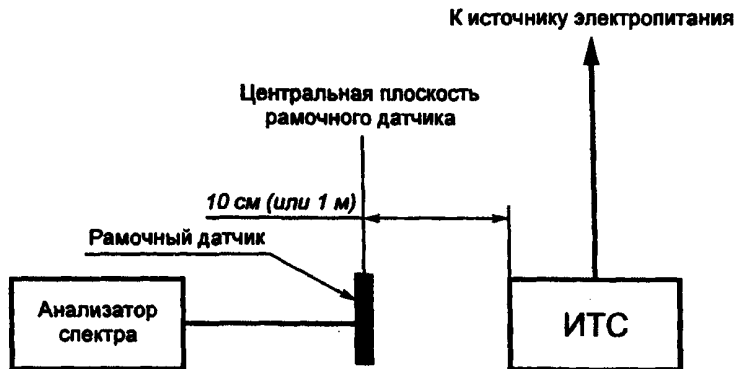
Рисунок А.2 — Испытательная установка для измерения магнитного поля, создаваемого ТС

Установка для проведения испытаний приведена на рисунке А.2.