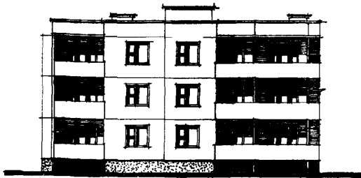
Ф А С А Д Ic-7с