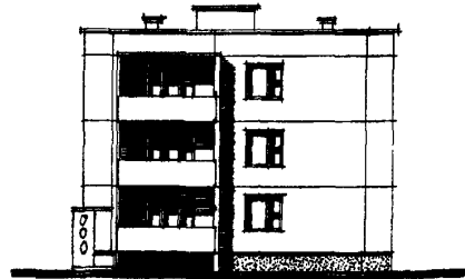
Ф А С А Д Ec-Ас